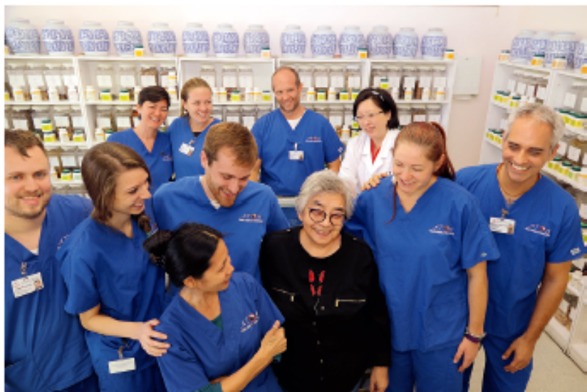
大西洋中医学院院长（中）和学生们

之初校园占地仅 42 平方米，仅有 10 名学生，发展到今天占地 1300 平方米，在校生 160 余人的高等中医学院，是美国东部地区唯一获准授予针灸和中医博士学位的学院，也是美国东海岸第一所拥有中医硕士和博士学位授予权的中医大学。