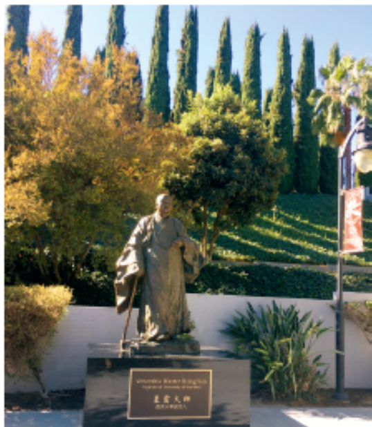
西来大学创始人星云大师雕像

位于美国加州的西来大学成立于 1991 年，是美国第一所佛教基金赞助的高等院校，也是唯一一所由华人资助、进入美国正规高等教育体系的大学。学校致力于为学生将来能够应对日益复杂的国际化环境和挑战打下坚实基础。作为多元学科与多元文化的高等教育机构，西来大学提倡将优秀的文化传统与全球化理念结合，为学生提供综合性的、以学生为中心的优