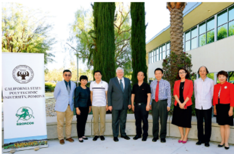
访问加州州立理工大学波莫纳分校

当前，中国和美国、加拿大的教育交流合作已成为很多学校国际交流的重要组成部分。美国加州州立理工大学波莫纳分校是全美七大理工大学之一，在加州，每 14 名工